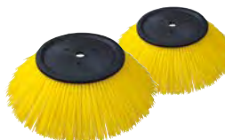
BALAI LATÉRAL PPL STANDARD X 2 SPPV01232