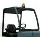
Toit de protection KTRI 00101