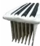
FILTRE POLYESTER X 1 FTDP00204