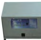
CHARGEUR EXTERNE 24V 100A BACA00137