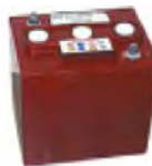
BATTERIE HUMIDE 24V 480AH BAAC00100