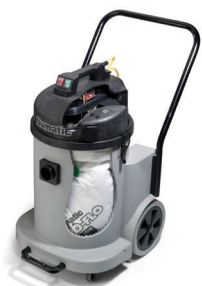
Système anti-colmatage AIRFLO