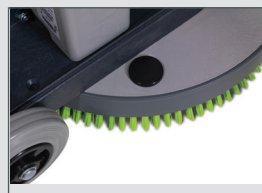
Gueuze de 10 kg supplémentaire en option