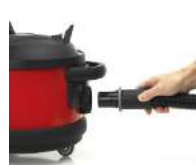
Connexion de cuve clipsable