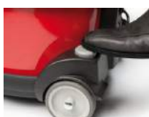
Interrupteur au pied