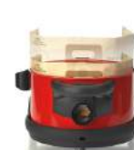
Mise en place facile du sac papier